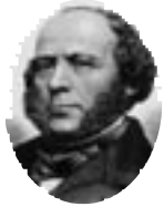
John Ericsson 1803-89